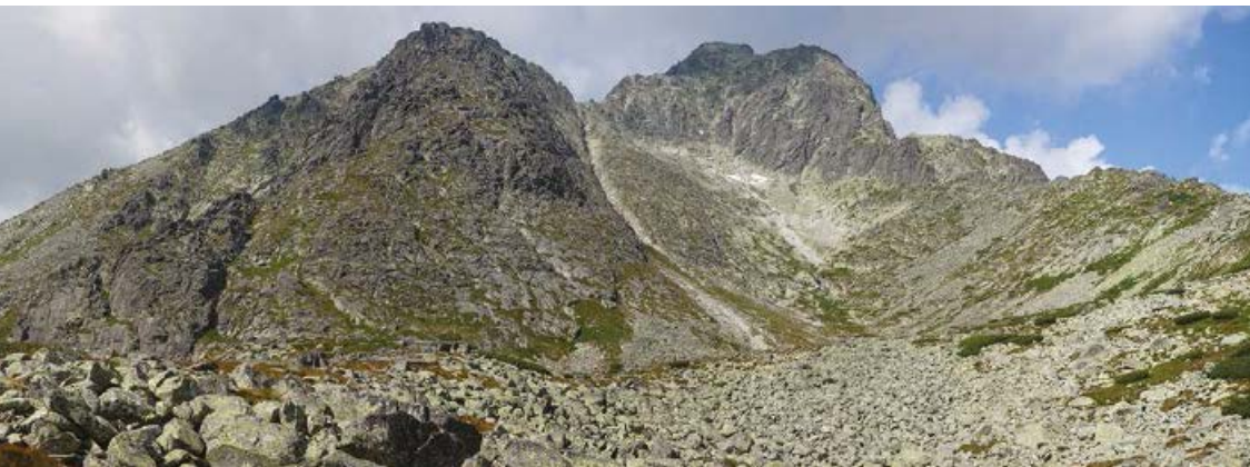
▲ Dolina Huncowska. Po prawej Kieżmarski i Mały Kieżmarski Szczyt. Z lewej Huncowski Szczyt.