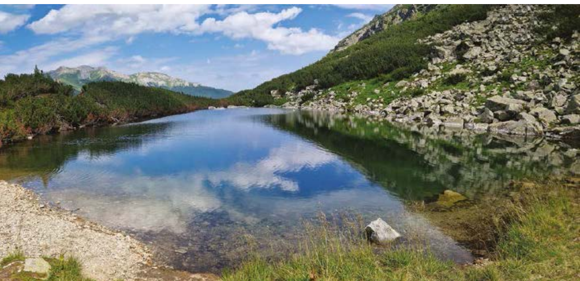
▲ Czarny Staw Kieżmarski, w tle Tatry Bielskie.

on ostro w skały, jest stromy, spadając małymi kaskadami wody. Szlak omija je początkowo po lewej stronie łatwiejszym terenem, do miejsca, gdzie wchodzi na skały. Stąd, około 30-metrowy odcinek wiodący skalną rynną jest ubezpieczony łańcuchami. Dodatkową trudność sprawia ciekająca tu często woda, co sprawia, że podeszwy są mokre i łatwo jest się poślizgnąć na śliskiej skale. Tak jak napisałem we wstępie, szlak uważam za relatywnie łatwy, jednak wiedzie on również północną wystawą i w przypadku zalodzenia może być tu zdecydowanie trudniej. Jest to o tyle istotne, że szlak Magistrali Tatrzańskiej ma opinię szlaku łatwego, dostępnego dla mniej doświadczonych turystów. W sumie jest to prawda, poza tym jednym fragmentem w Lendackim Żlebie.