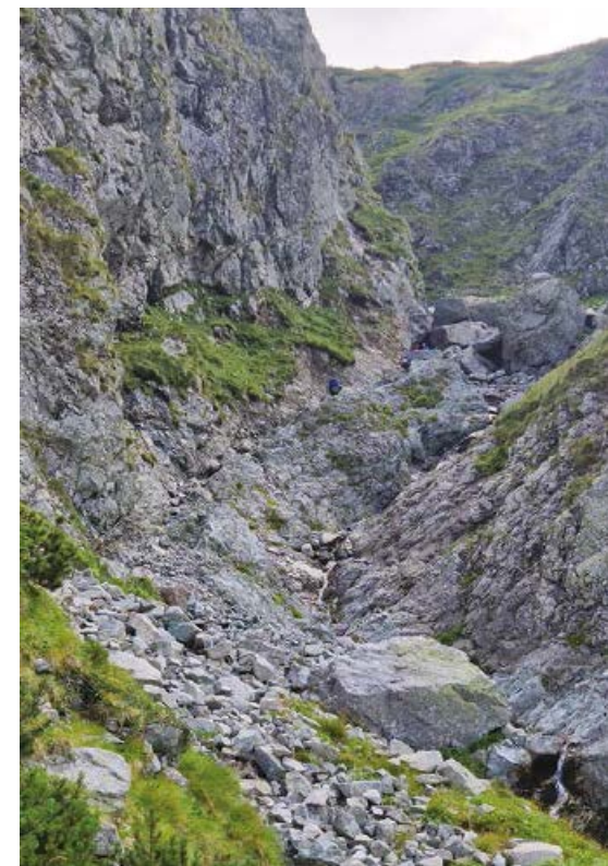
▲ Trudny technicznie fragment Tatrzańskiej Magistrali w Skrajnym Lendackim Żlebie.

Rakuski Przechód 2012 m, od Zielonego Stawu 1:30 h, 470 mg, od Białej Wody Kieżmarskiej 3:45-4:00 h). Rakuski