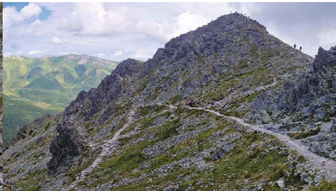
▲ Ostatnie zakosy szlaku przed granią. Po lewej Lendacka Baba, z prawej Rakuska Czuba i Przechód.

Szlak trawersuje dalej zboczami Huncowskiego Szczytu, starając się prowadzić po poziomicy lub lekkim obniżaniem aż do osiągnięcia moreny bocznej dawnego kotła lodowcowego. Szlak zakręca tu i grzbietem moreny sprowadza do mostku ponad Łomnickim Potokiem wypływającym z Łomnickiego Stawu.