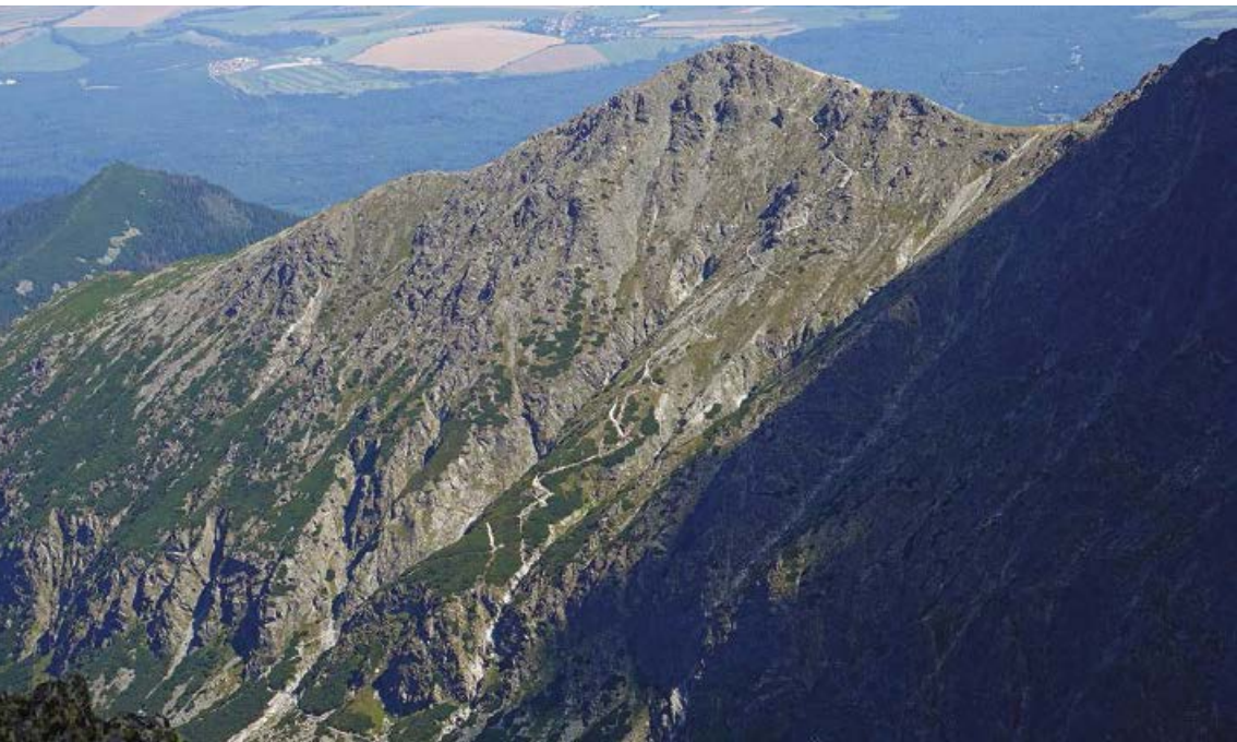
▲ Zakosy szlaku Tatrzańskiej Magistrali na Rakuski Przechód, z lewej Rakuska Czuba.