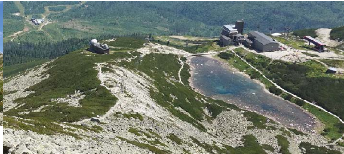
▲ Kompleks kolejki linowej na Łomnicę i Obserwatorium Meteorologiczne przy Łomnickim Stawie. W dole widać stację pośrednią kolejki – Start (1160 m).