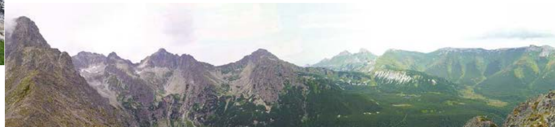
▲ Widok z Rakuskiej Czuby na zachód.

Otwiera się stąd piękny widok na Łomnicę, grań Wideł i Kieżmarski Szczyt, których ściany tworzą jeden z najwspanialszych skalnych amfiteatrów w Tatrach.