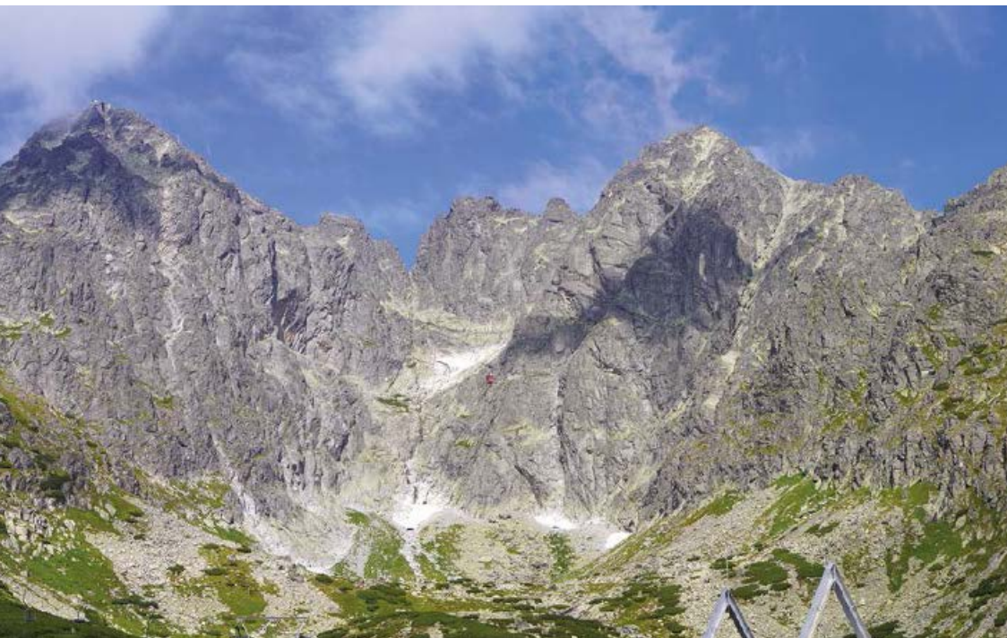
▲ Skalny amfiteatr – Łomnica, Widły i Kieżmarski – widok nieco zepsuty przez infrastrukturę kolejki linowej na Łomnicę.

Niebieskim, okrężnym szlakiem wokół Małej Rakuskiej Czuby możemy dotrzeć albo do Łomnickiego Stawu, lub odbijając na Folwarskiej Polanie do żółtego szlaku Doliną Kieżmarską, którą podchodziliśmy do Zielonego Stawu. My schodzimy dalej zielonym szlakiem aż do centrum Tatrzańskiej Łomnicy (3,2 km, 0:50 h), ale możemy też wybrać zejście asfaltową drogą sprowadzającą do dolnej stacji kolejki gondolowej.