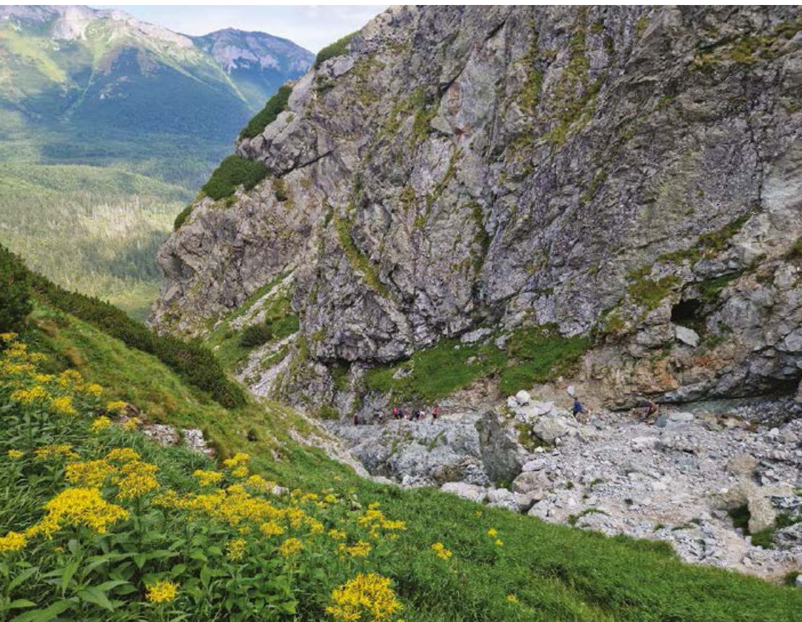
▲ Widok z góry na trudny fragment w Lendackim Żlebie i dawną sztolnię górniczą.

Skalnaté pleso, 1764 m, 2,9 km, 1:00 h, GPS 49.187329, 20.232834) i dalej albo: