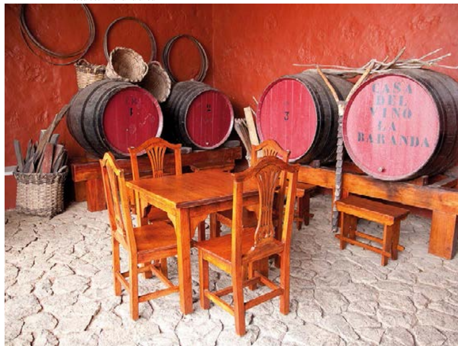
▼ Casa del Vino La Baranda

Miody oznaczone etykietą „Miel de Teneryfe” spełniają restrykcyjne wymagania dotyczące jakości.