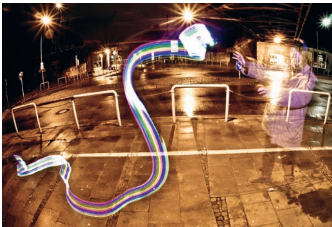
Sesja malowania światłem sfilmowana kamerą wideo z obiektywem typu rybie oko o ogniskowej 10 mm

Poza fotografem (który musi operować aparatem) potrzebny będzie jeszcze przynajmniej jeden „rysownik”, który, używając latarki lub innego źródła światła, będzie „rysował” w powietrzu ustalone wcześniej kształty, teksty lub znaki. Musi to robić w czasie, kiedy migawka apa-