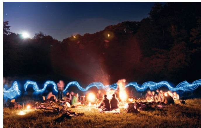
Ognisko obozowe z rysunkiem świetlnym; f/4,5, 20 sekund, ISO 500

Im bardziej złożony obraz zaplanujesz, tym trudniejsze będzie ledzenie jego realizacji. W takiej sytuacji pomocne może być rozmieszczenie w fotografowanej scenie znaków orientacyjnych, które na zdjęciu będą niewidoczne lub da się je łatwo wyretuszować. Czasami wystarczy umieścić w strategicznych punktach pudełka po zapalniczkach lub kamyki.