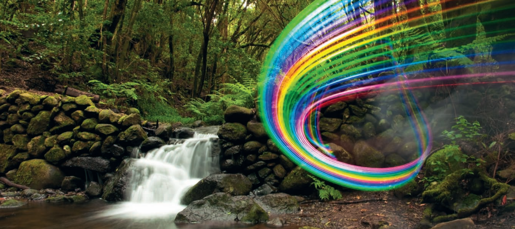
Obraz malowany światłem; La Gomera (Wyspy Kanaryjskie); f/22, 3 sekundy, ISO 100