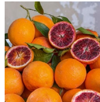
▲ Pomarańcze – odmiana tarocco