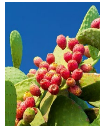
▲ Opuncja figowa

Sycylia słynie z doskonałych win regionalnych: nero d'Avola, marsala, malvasia i passito, etna bianco i etna rosso.