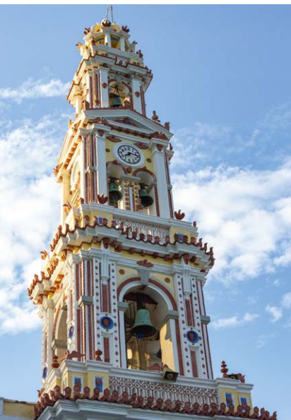
▲ Dzwonnica klasztoru Panormitis