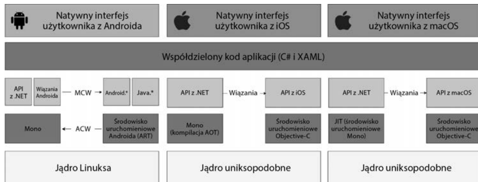
Rysunek 1.1. Implementacje Xamarina

W obsługiwanych platformach Xamarin udostępnia wiązania dla prawie całych pakietów SDK. Xamarin udostępnia też mechanizmy do bezpośredniego korzystania z bibliotek języków Objective-C, Java, C i C++, co daje możliwość używania dużej ilości zewnętrznego kodu. Możesz stosować istniejące biblioteki dla systemów Android, iOS i macOS napisane w językach Objective-C, Swift, Java lub C czy C++.