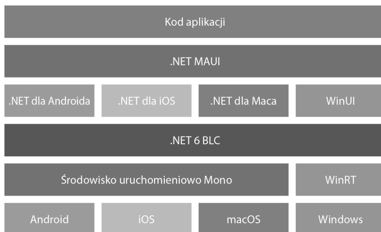
Rysunek 1.2. Architektura .NET MAUI

Na rysunku 1.2 widać, że dla wszystkich obsługiwanych systemów operacyjnych używana jest wspólna biblioteka BCL . Dla BCL dostępne są dwa środowiska uruchomieniowe, WinRT i Mono Runtime, zależne od platformy. Dla każdej platformy istnieje specjalna implementacja .NET, która zapewnia pełną obsługę tworzenia aplikacji natywnych.