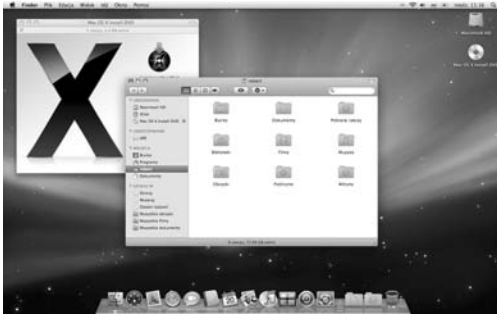
Rysunek 1.7. Po zakończeniu instalacji na ekranie zostanie wyświetlone biurko systemu operacyjnego Mac OS X 10.5 oraz okno katalogu domowego użytkownika