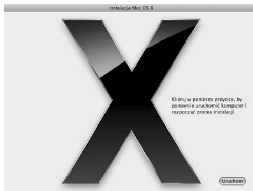
Rysunek 1.4. Program instalacyjny prosi o ponowne uruchomienie komputera