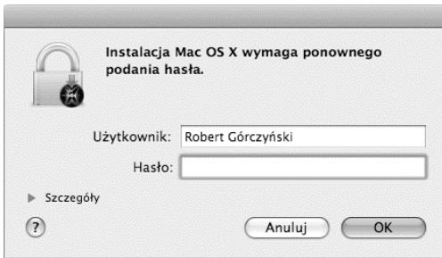
Rysunek 1.5. W celu rozpoczęcia instalacji należy podać nazwę i hasło użytkownika z uprawnieniami administratora