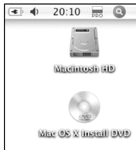
Rysunek 1.2. Gdy umieścisz w napędzie płytę Mac OS X Install DVD, jej ikona zostanie wyświetlona na biurku...