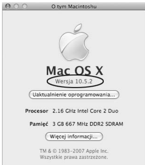
Rysunek 1.1. Informację o numerze wersji bieżącego systemu Mac OS X można znaleźć w oknie dialogowym O tym Macintoshu