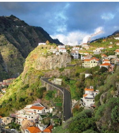
▲ Ribeira Brava