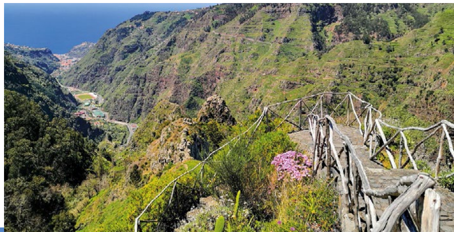
▲ Widok z doliny na Ribeira Brava, położoną nad oceanem

Nazwa Ribeira Brava, czyli Dzika Rzeka – nadana osadzie przez portugalskich kolonizatorów w XV w. – pochodzi od wartkiej rzeki, która spływa górkim zboczem, pokonując odcinek 8 km. W miesiącach deszczowych potrafi być bardzo niebezpieczna.