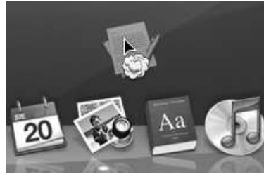
Rysunek 5.7. Usuwanie skrótu programu z Docka