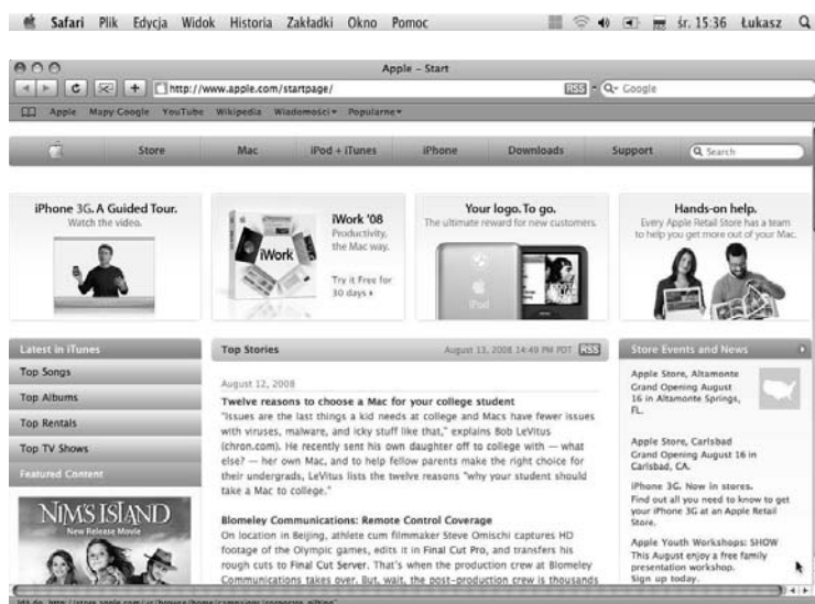
Rysunek 5.3. Uruchomiona przeglądarka Safari