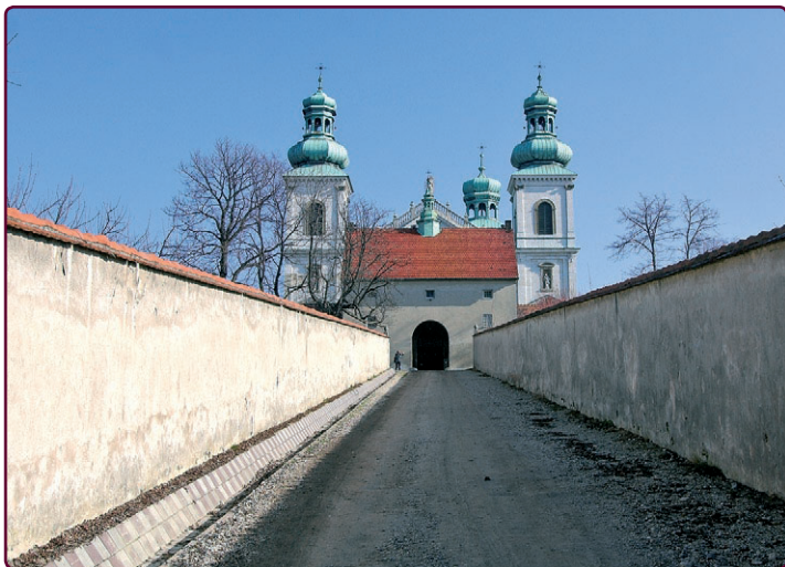
Klasztor Kamedułów na Bielanych

Z pętli jedziemy w lewo ulicą Skotnicką, która po chwili z drogi głównej staje się drogą boczna, skręcając przy okazji w prawo. W tym miejscu należy szczególnie uważać, gdyż droga główna staje się później ulicą Winnicką i prowadzi do Kostrza. Jedziemy zatem dalej ulicą Skotnicką, a po kilkuset metrach, gdy kończy się asfalt, kontynuujemy jazdę drogą szutrową. Mijamy po lewej stronie ostatni dom i pierwsze odbicie w prawo. To ważne – w prawo skręcamy dopiero przy drugim odbiciu. Jedziemy ulicą Gronostajową i po kilku minutach docieramy do krzyżówki z zielonym domem. Jedziemy prosto, mijamy znajdujący się po prawej stronie dom i zbaczamy w lewo, w las. Tam główną ścieżką docieramy do drewnianego mostku i skręcamy w prawo, do cmentarza w Pychowicach. Jedziemy wzdłuż ogrodzenia i dalej, aż do ulicy Norymberskiej. Przekraczamy ją i jedziemy na wprost, mając po lewej stronie ogrodzenie jednostki wojskowej. Następnie czeka nas krótka jazda w lesie, wzdłuż jednego z urwisk dawnego kamieniołomu na Zakrzówku (widać głównie ogrodzenie znajdujące się po prawej stronie). Po chwili zaczyna się asfalt. Zjeżdżamy prawą odnogą i po pokonaniu kilkusetmetrowego odcinka drogi szutrowej, docieramy do parkingu. Stamtąd ścieżką rowerową – wzdłuż ulic Twardowskiego, Kapelanka i Monte Cassino – docieramy do ronda Grunwaldzkiego.