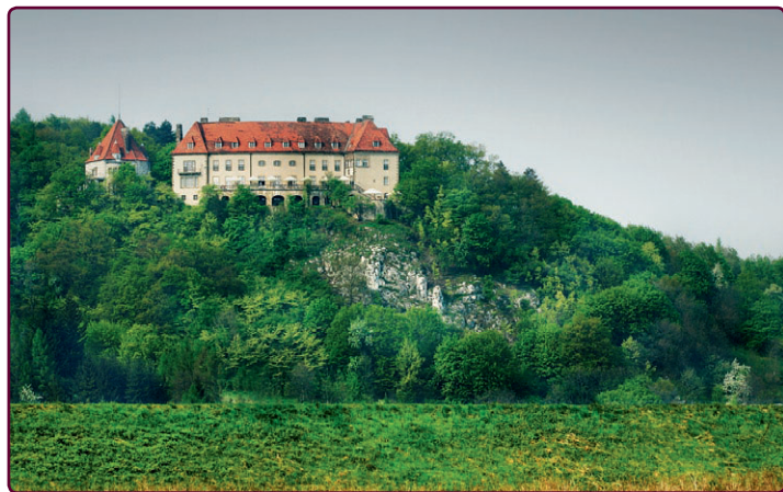
Rezydencja w Przegorzalach

Wznoszący się nieco dalej na zachód klasztór Kamedułów na Bielanych to budowla pochodząca z początków XVII w., związana z niezwykle barwną historią i osobą Mikołaja Wolskiego – marszałka wielkiego koronnego. Jak podaje przekaz z okresu założycielskiego, klasztor miał powstać na terenie należącym do kasztelana Sebastiana Lubomirskiego. Nie był on jednak przychylny budowie i Mikołaj Wolski posłużył się specjalnym fortelem, aby go do tego przekonać. Wolski wyprawił bowiem ucztę, w której udział wzięli najznamienitsi goście i na której publicznie opowiedział o swojej intencji wybudowania kościoła. Lubomirski nie miał w zasadzie wyjścia – wśród patrzących na niego oczu zgodził się na oddanie ziemi, w zamian za co Wolski ofiarował mu niezwykle cenną srebrną zastawę, na której odbywała się uczta. Od materiału, z jakiego ją wykonano pochodzi nazwa miejsca, w którym stanął kościół – Srebrna Góra.