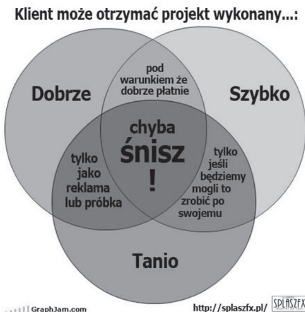
Rysunek 2.2. Prawo dwóch trzecich (SplaszFX 2011)

Mimo zastosowanego tu lekkiego podejścia do tematu trzeba jednak przyjąć do wiadomości i zaakceptować fakt, że prawo dwóch trzecich nie jest żartem informatyków — w taki sposób naprawdę działa wszelki biznes. Nie należy oczekiwać wysokiej jakości, jeśli nie chce się zainwestować odpowiednich nakładów. Niestety, klienci często sami