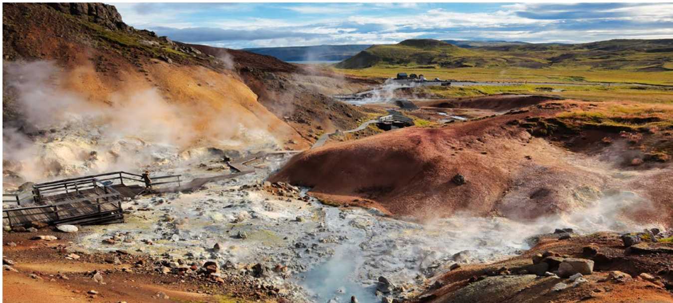
▼ Obszar geotermalny Krýsuvík

To jedno z najliczniej zamieszkiwanych przez ptaki miejsc na Islandii, a być może i w całej Europie. Pionowe ściany wpadające wprost do oceanu są domem dla tysięcy ptaków – głównie mew, nurzyków i alk. Od połowy marca do końca sierpnia można tu obserwować maskonury – symbol Islandii. Przy odrobinie szczęścia naszym oczom ukażą się również pływające w pobliżu brzegu wieloryby i delfiny. Fale morskie, uderzając o skaliste wybrzeże, nadają mu formę urwisk. Klify ciągną się na długości ok. 7 km. Ich przeciętna wysokość wynosi 50 m, a w najwyższym miejscu sięgają ok. 70 m, co czyni je największymi klifami południowo-zachodniej Islandii. Szlak pieszy prowadzi do maleńkiej latarni morskiej, wzniesionej w 1965 r. Rozpościera się stąd wspaniały widok na ocean. Do klifów Krýsuvíkurborg zaleca się dojazd samochodem terenowym.