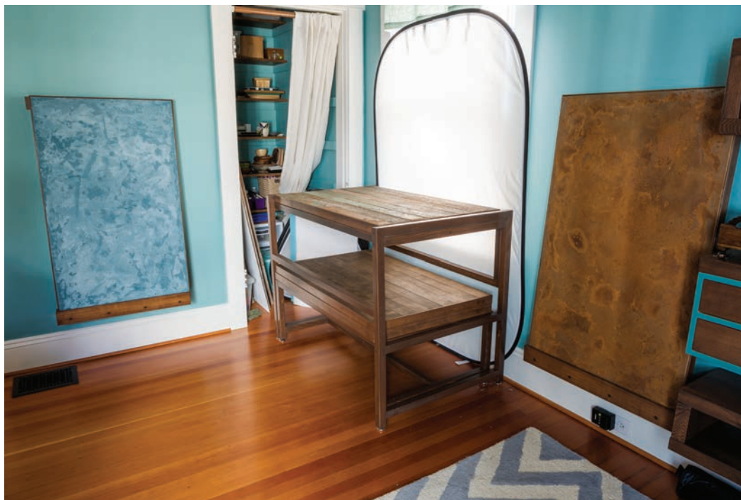
3.27. Ten stół został specjalnie zaprojektowany na potrzeby fotografii kulinarnej i skonstruowany przez firmę Kula Solutions z Portland (Oregon). Zestaw składa się z dwóch zagnieżdżonych stołów i pięciu wymiennych blatów

Teraz posługuję się głównie stołem przygotowanym specjalnie na potrzeby mojej fotografii kulinarnej (zdjęcie 3.27). W istocie jest to zestaw dwóch włożonych w siebie stołów — jeden służy do robienia zdjęć z boku i z naturalnej perspektywy, a drugi do fotografowania z góry. Mają one wymienne blaty, w tym jeden z podniszczonego drewna, inny z imitacji betonu, jeszcze inny z zardzewiałej blachy. Świetnie nadają się one do mojej pracy i ułatwiają zmianę stylistyki zdjęcia — wystarczy wymienić blat.