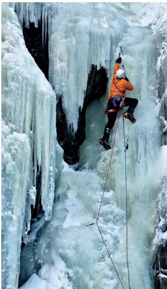
▲ Wspinacz na lodospadzie WI4, Rjukan, Norwegia. Grudzień 2009

Poniżej przytaczam pełną sekwencję czynności, które zwykle wykonuję podczas górskiej ekspedycji w związku z fotografowaniem. Jak widać, lista jest długa, ale wszystko odbywa się bardzo szybko. Sztuka polega na tym, aby całą procedurę wykonywać odruchowo, a przy tym dokładnie. Pomińnięcie jakiejś czynności lub poświęcenie jej zbyt dużo czasu może skończyć się tym, że stracisz okazję na doskonałe ujęcie.