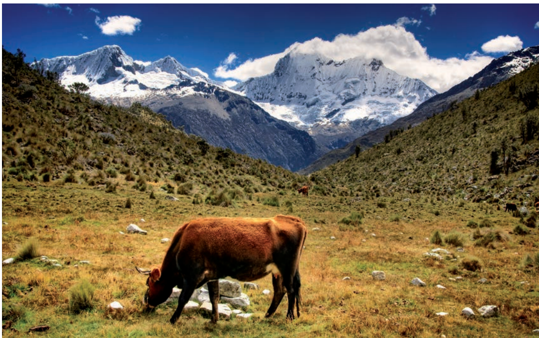
▲ Pastwisko u podnóża Nevado Chopicalqui jest dobrym miejscem na bazę, Kordyliera Biała. Czerwiec 2009

Aparaty, z wyjątkiem najtańszych, są na tyle szczelne, że bez problemu można ich używać we mgle, przy lekkiej mżawce lub podczas opadów suchego śniegu. Natomiast grad może fizycznie uszkodzić każdy sprzęt – a także fotografa!