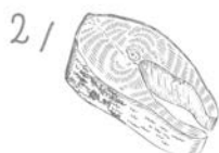
Dziko żyjące ryby