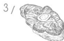
Mięso ze zwierząt z wolnego wybiegu