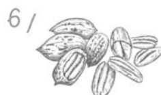
Orzechy i nasiona