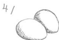
Jaja z wolnego wybiegu