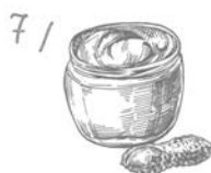
Masła orzechowe, pasta tahini