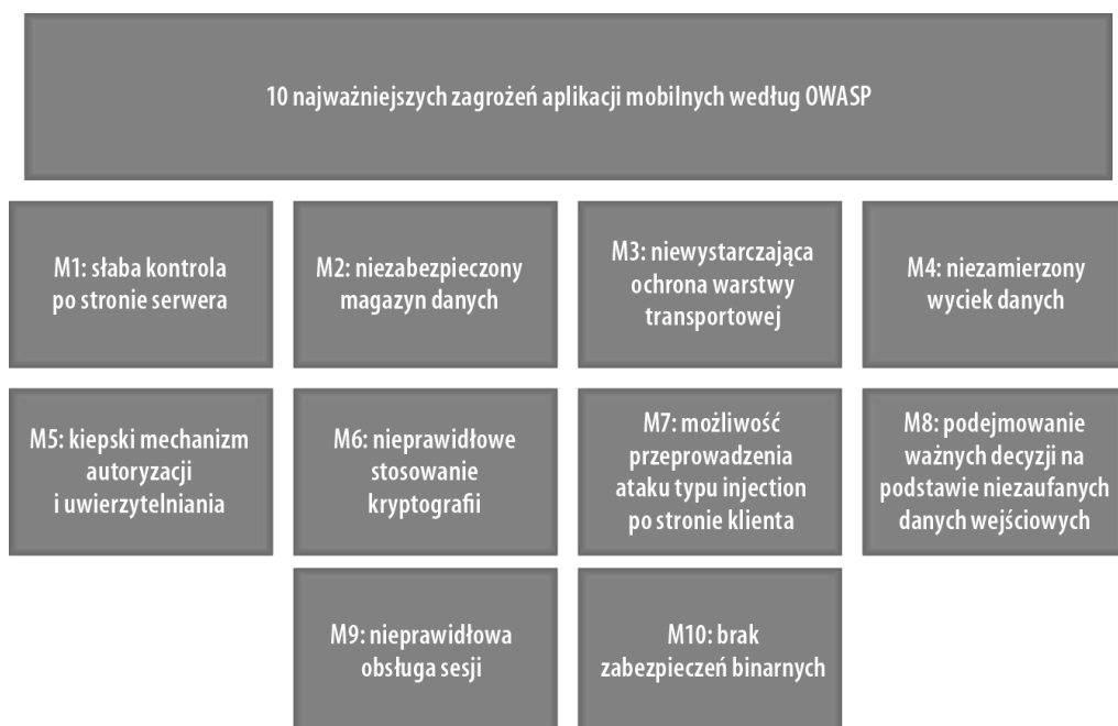
Rysunek 1.2. Wymienione przez grupę OWASP dziesięć najważniejszych problemów związanych z bezpieczeństwem na platformach mobilnych

Podobnie jak w przypadku dziesięciu największych zagrożeń OWASP, twórcy projektu Mobile Security zdefiniowali odpowiadających im dziesięć najważniejszych problemów związanych z bezpieczeństwem na platformach mobilnych. W tym zakresie projekt dość szeroko kategoryzuje pewne największe zagrożenia. Teraz pokrótce podsumuję pozycje wymienione na tej liście OWASP. Znacznie bardziej szczegółowe omówienie poszczególnych problemów i wskazówki dotyczące ich rozwiązań znajdziesz na stronie wiki projektu pod adresem https://www.owasp.org/index.php/OWASP_Mobile_Security_Project#tab=Top_10_Mobile_Risks . Graficznie dziesięć najważniejszych problemów według OWASP pokazałem na rysunku 1.2.