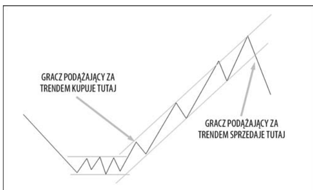
Rysunek 4.1. Podążanie za trendem